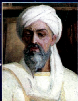
Абу Али ибн Сино