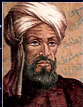
Муҳаммад Мусо Хоразмий

Мен ёшларимизга мурожаат қилар эканман, уларга доимо: “Биз буюк аجدодларимиз билан фахрланишимиз, ғурурланишимиз керак”, деб айтаман. Айни вақтда “Фақат ғурурланишнинг ўзи етарли эмас, келинглар, ўзимиз ҳам, худди улар каби, мана шу бебаҳо меросга ўз ҳиссамизни қўшайлик!” деб такрорлайман.