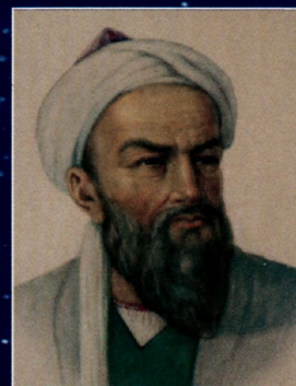
Абу Райҳон Беруний

“Ўрта асрлар Шарқ алломалари ва мутафаккирларининг тарихий мероси, унинг замонавий цивилизация ривожигаги роли ва аҳамияти” мавзусидаги халқаро конференция.